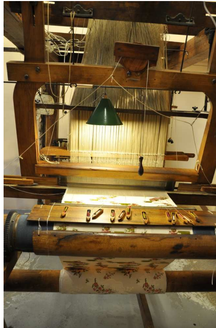
Métier à tisser Maison des Canuts (Lyon 4 e )