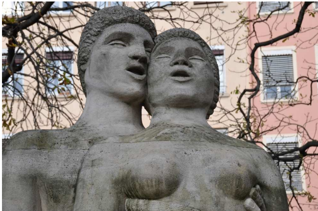
Le Chant des Canuts Square Dejean (Lyon 4 e )